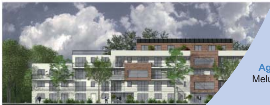
FACADE SUR RUE 1/200