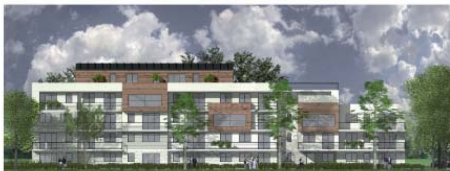
FACADE SUR JARDIN 1/200

Agence de rattachement : Melun Val de Seine